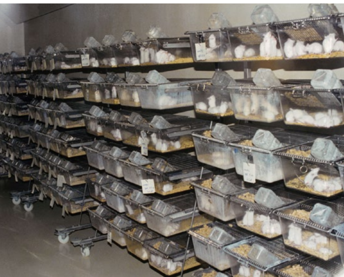
© A. Farkas/afif, Cover: Ärzte gegen Tierversuche

Allein in Deutschland werden den unvollständigen offiziellen Statistiken zufolge Jahr für Jahr fast drei Millionen Versuchstiere geopfert. EU-weit sind es jährlich rund zwölf Millionen Tiere, bei insgesamt steigender Tendenz.